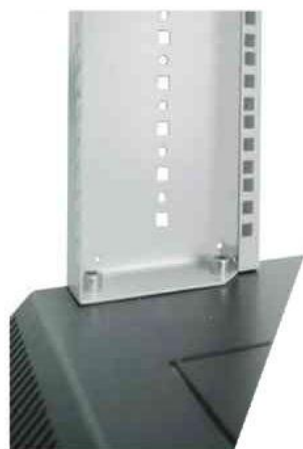
Assemblage du bas