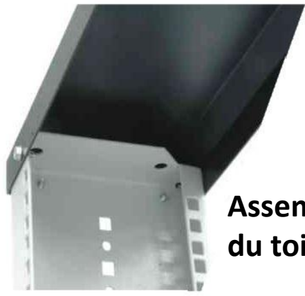
Assemblage du toit